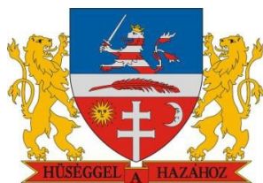
Bonyhád Maďarská republika