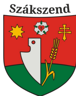
Szákszend Maďarská republika