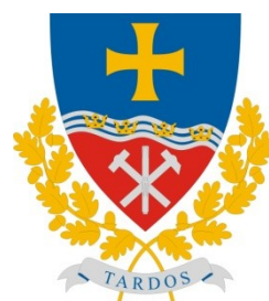
Tardos Maďarská republika