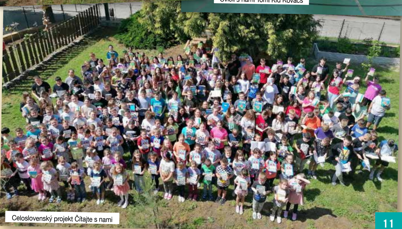
Celoslovenský projekt Čítajte s nami