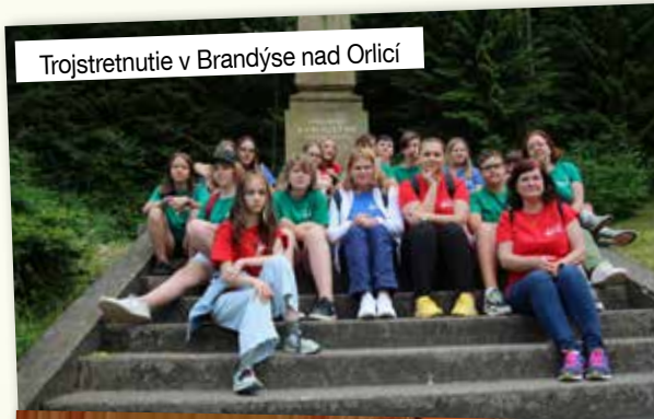
Trojstretnutie v Brandýse nad Orlicí